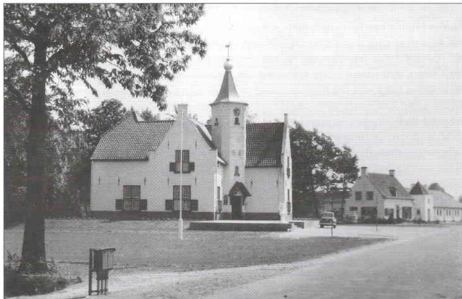
In het gemeentehuis van Maarheeze op Cranendonck vond op 6 april 1951 de oprichting van de Stichting Industrievestiging in de Poort van Brabant plaats. Opname van 25 juni 1954.