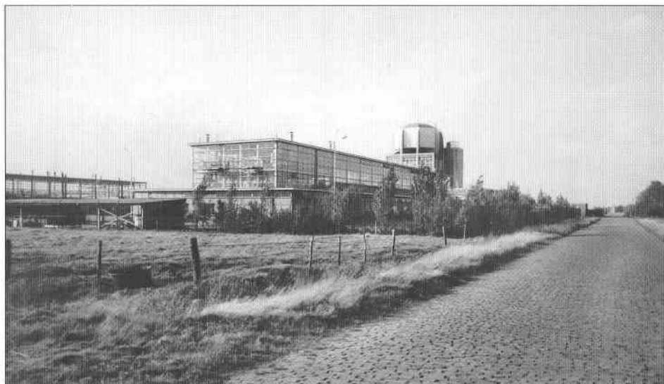
Gezicht op de Philipsfabrieken aan de Dr. A. Philipsweg in Maarheeze, prentbriefkaart uit 1958 (collectie J. Biemans, 's-Hertogenbosch).

werd nog in 1954 de eerste spade in de grond gezet voor de eerste fabriek. In totaal verrezen tussen 1955 en 1959 vier gebouwen die chemische producten of onderdelen fabriceerden voor de lichtgroep van Philips. Op 24 april 1959 werd Philips Maarheeze officieel geopend. Ruim 350 werknemers vonden er rond die tijd emplooi. De in 1957 gebouwde 'toren' bepaalde, tot de sloop in 2013, de skyline van Maarheeze.